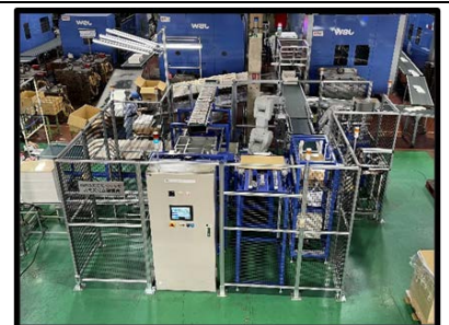
自動化にも取り組んでいます