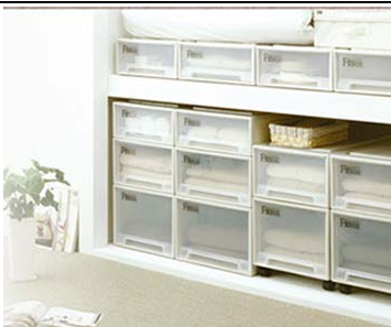
信頼のブランド【Fits ケース】

当社は創業74年を迎え、「感動と喜びを分かち合う。」“Happy life with TENMA”という経営理念のもとプラスチック製品を設計から加工、組み立てまで一貫して行っています。社風は地元からの社員がほとんどで活気に満ちて頑張っています。