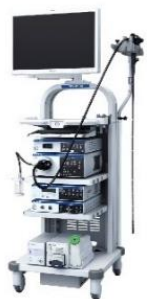
内視鏡ビデオスコープシステム