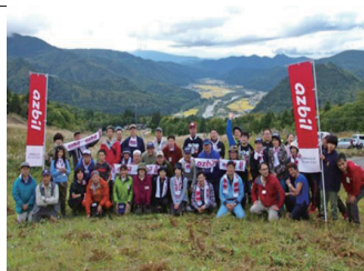
ひめさゆり保全活動（南会津町）