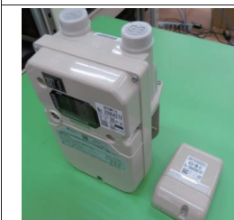
LP ガスメーター、自動通報装置

当社は LP ガスメーター、都市ガスメーター、回転子式ガスメーター、バルブなど、広範囲におけるメーター及び流量計などの生産を行なう計量器メーカーです。当社はアズビル金門の中核工場として半世紀以上の歴史を持ち、お客様に安心・安全な計量機器をお届けしています。