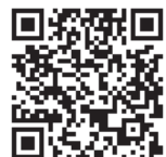
企業用 PR 動画