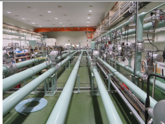
大容量ガスメーター校正試験装置