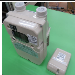
LP ガスメーター、自動通報装置

当社はLP ガスメーター、都市ガスメーター、回転式ガスメーター、バルブなど、広範囲におけるメーター及び流量計などの生産を行なう計量器メーカーです。当社はアズビル金門の中核工場として半世紀以上の歴史を持ち、お客様に安心・安全な計量機器をお届けしています。