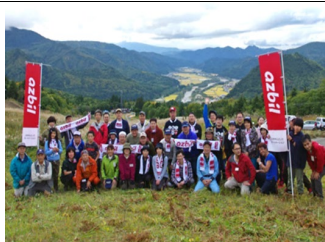
ひめさゆり保全活動（南会津町）