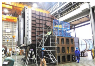
日本最大級の送風機を作ります！

日本機械技術 白河工場は、近年受注が増えつつある、大型送風機専用の組立工場です。ここでは、レーザーマシンで鋼板をカットし、製缶・溶接作業によって送風機のようなパーツを作成し、塗装・組立・性能試験までを行っています。作業グループは職種に応じて3つに分かれていますが、忙しいときはお互いのグループをサポートする、チームワークの良さが自慢です！