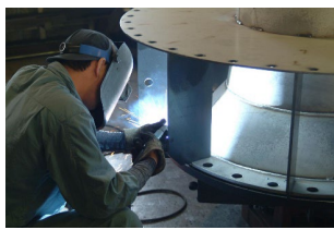
高度な溶接技術が習得できます