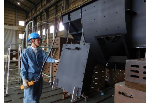
入社2~3年目の若手が活躍中です